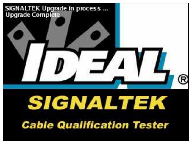
Abbildung 2: Firmware-Upgrade ist abgeschlossen